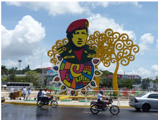
Die Regierung Ortega hat gute Gründe, Chavez ein Denkmal zu errichten