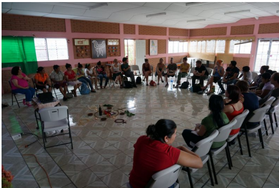
Zu Gast bei der Frauenorganisation FEM in Estelí