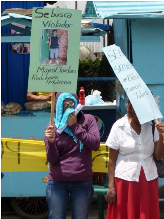
Die Frauenbewegung protestiert gegen die Straflosigkeit bei Männergewalt