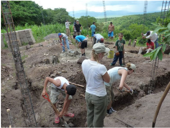
Baustelle in El Bocón

Nach einer eindrucksvollen ersten Woche stand dann der Bau einer casa comunal in El Bocón, einem kleinen Dorf in der Gemeinde San Isidro, an. Das MCM hatte inzwischen alle organisatorischen Vorbereitungen getroffen. Der Empfang der Brigade war herzlich. Das an einem Berghang abgeschieden liegende Dorf wartete schon viele Jahre auf ein Gemeindeaktionszentrum.