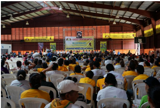
Jubiläumskongress des Movimiento Comunal Nicaragüense

Andere Organisationen, wie zum Beispiel die Menschenrechtsorganisation CENIDH, arbeiten verstärkt mit der rechten Opposition zusammen.