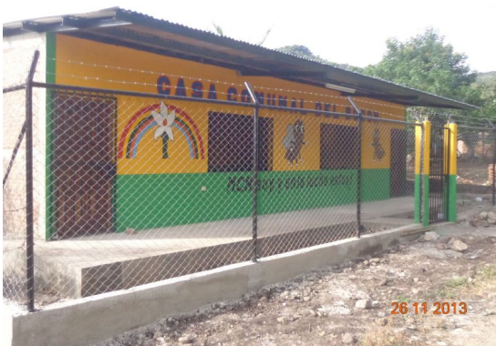
Am 5. Dezember wurde die casa comunal eingeweiht