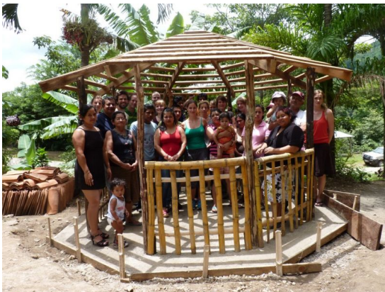
Nach fünf Tagen Bauzeit fehlt nur noch das Dach