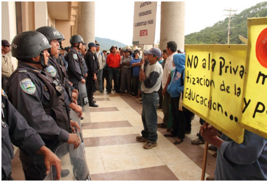
Polizei und Justiz auf der selben Seite: Protest von COPINH vor dem Justizpalast von Esperanza