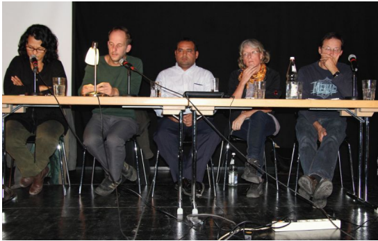
Gemeinsam mit FIAN München präsentiert das Ökumenische Büro drei Gäste aus Honduras im EineWeltHaus