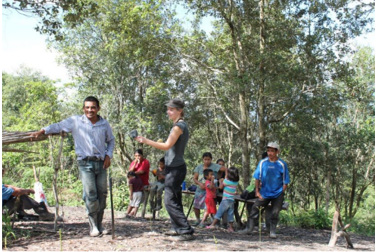
Die Bewohner_innen von Rio Blanco berichten von einem Überfall der Polizei auf ihre Gemeinde

Im westlichen Hochland von Honduras sind 47 Konzessionen für Flussprivatisierungen und Wasserkraftwerke bekannt. 46 der Projekte werden von der lokalen indigenen Bevölkerung vehement abgelehnt. Zum Präzedenzfall und Symbol des Kampfes der Lenca-Gemeinden für ihre Rechte hat sich in diesem Jahr das Staudammprojekt „Agua Zarca“ in der Region Rio Blanco entwickelt. Am Rio Gualcarque wollte die honduranische Gesellschaft DESA gemeinsam mit der chinesischen SINOHIDRO im Frühjahr 2013 mit den Bauarbeiten beginnen. Die betroffenen Gemeinden hatten den Bau in Gemeindeversammlungen klar abgelehnt. Sie berufen sich darauf, dass der honduranische Staat ihre in der ILO-Konvention 169 zum Schutz indigener Ethnien garantierten Rechte zu respektieren hat. Nachdem dies nicht der Fall war, begannen Bewohner_innen der betroffenen Gemeinden mit Unterstützung des Zivilen Rates der Volks- und indigenen Organisationen von Honduras (COPINH) am 1. April die Zufahrtsstraße zum Baugelände zu blockieren. Die Betreibergesellschaft DESA reagierte mit der üblichen Doppelstrategie: dem Versuch, die Gemeinden und ihre Organisation zu spalten und mit Repression gegen diejenigen, die sich weder kaufen, noch einschüchtern ließen. Militär und Polizei wurden auf dem Baugelände stationiert.