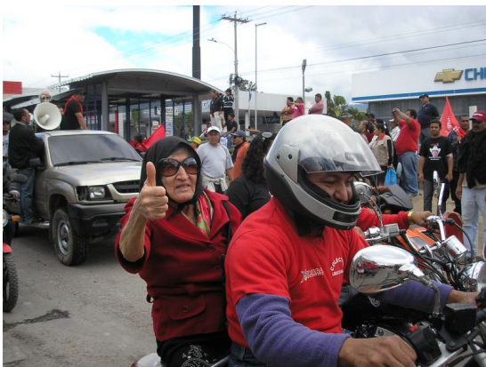
LIBRE ist die Partei mit der stärksten öffentlichen Unterstützung

Weitere Unregelmäßigkeiten betrafen das Wahlregister, hier nennt die EU-Mission eine Fehlerquote von 30%. Die Regierungspartei verteilte in großem Umfang Wahlgeschenke, etwa Küchenherde, und drohte mit der Einstellung von Zahlungen aus dem Armutsbekämpfungsprogramm der Weltbank im Falle ihrer Wahlniederlage.