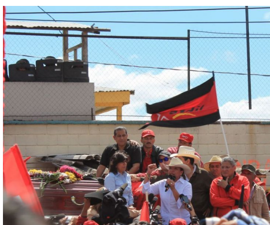
LIBRE, die Partei von Mel Zelaya und seiner Ehefrau Xiomara ist nach wie vor in der Opposition

Die Besonderheit in diesem Gefüge bildet das Auftreten der neuen Partei LIBRE, mit der sich enorme Hoffnungen auf einen politischen und gesellschaftlichen Wandel verbanden. Hoffnungen, die durch die Wahlniederlage vom 24. November vorerst gedämpft wurden.