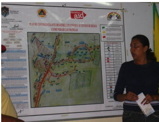
Eine Mitarbeiterin vom Movimiento Comunal erläutert eine Notfallplan für den Katastrophenfall

Um die Lage der Marginalisierten zu verbessern und sie gegen Katastrophen zu wappnen, sind die Schaffung ökonomischer Perspektiven, verstärkter Umweltschutz und besserer Zugang zu Bildung und Gesundheit notwendig. Dafür kämpfen unsere Partnerorganisationen in Mittelamerika.