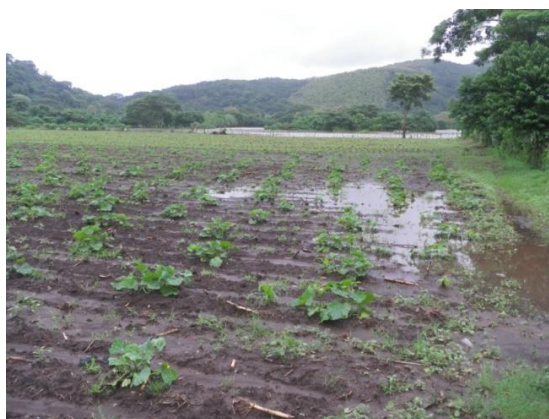
Zerstörte Felder nach der Unwetterkatastrophe E-12