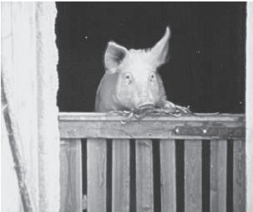
Agrarsubventionen der EU stehen scheinbar im Widerspruch zur Freihandelspolitik der EU und damit zu den Freihandelsverträgen mit den Ländern der Peripherie. Scheinbar, denn sie dienen der Zementierung von Abhängigkeitsverhältnissen.

Wenn es also um die Verteidigung ihrer Interessen geht, ist die Europäische Union durchaus bereit, zu harten Bandagen zu greifen, wie auch Tomas Ries, Direktor des Swedish Institute of International Affairs , in einer Studie des European Institute for Security Studies betont: „Der Schutz der Handelsströme erfordert die Fähigkeit zu globalen zivil-militärischen Einsätzen (Schutz der Seestraßen und kritischer Knotenpunkte etc.) und ein gewisses Maß an Machtdemonstration (präventiven Operationen, Regulierung regionaler Instabilität).“ 13 Die Operation Atalanta, die erste maritime Mission der EU, an der auch die Bun-