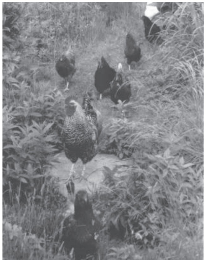
Frau Merkel, dahinter Herr Sarkozy, etwas sich selbst aufplustern, in Pose setzend und alle anderen folgen, nicht im Gleichschritt, aber sie folgen.

Die EU ist aber mehr als nur globaler Macht-Traum. Die EU ist ein Macht-Raum, der sich inzwischen nicht mehr nur nach Innen, sondern