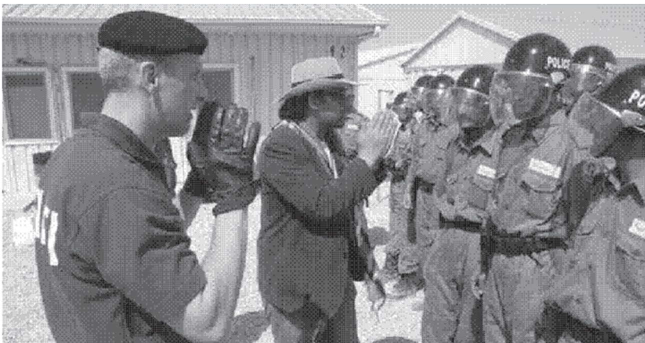
Polizetraining in Afghanistan