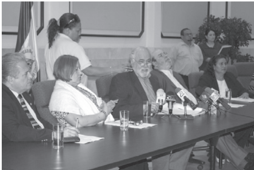
Oberster Gerichtshof

Der Betrug bei den Gemeindevahlen – von dem viele sogar behaupten, er wäre mit Alemán verabredet worden – schränkte Alemáns Durchsetzungsvermögen für weitere Geschäfte ein. Noch nicht einmal die Drohungen des Präsidenten, ihn wieder ins Gefängnis zu schicken, ermöglichten