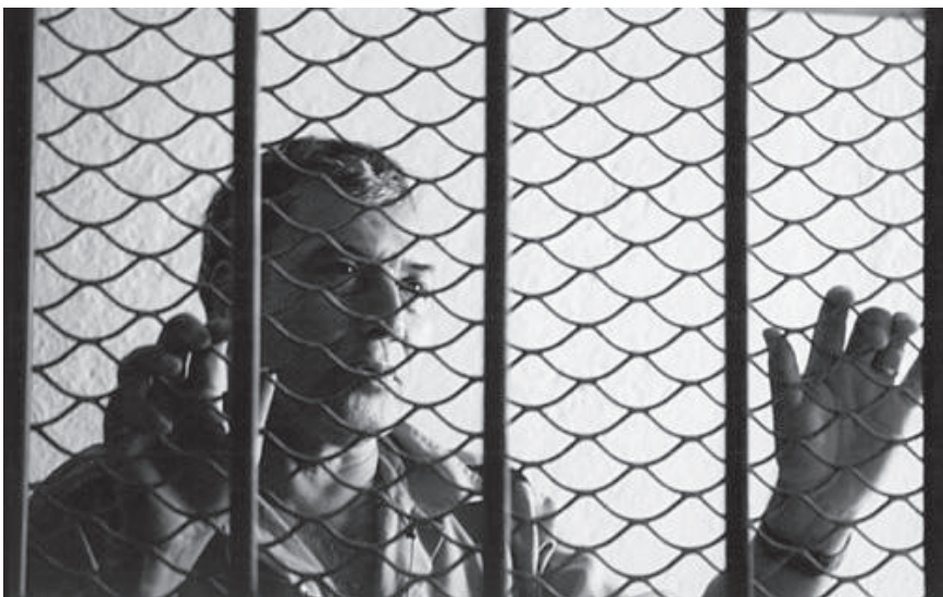
Im Gefängnis von Zihuatanejo (2005)

Im Oktober 2004 wird er des Mordes bezichtigt und festgenommen. Obwohl es dafür keinerlei Beweise gibt, wird er zehn Monate im Gefängnis festgehalten, bis im September 2005 ein Gericht seine Unschuld bescheinigt. Die Menschenrechtsorganisation Centro de Derechos Humanos de la Montaña Tlachinollan übernimmt seine Verteidigung vor Gericht und macht den Fall international bekannt. Im Jahr 2005, als er im Gefängnis ist, erkennt ihn Amnesty International als Gefangenen aus Gewissensgründen an. Unter an-