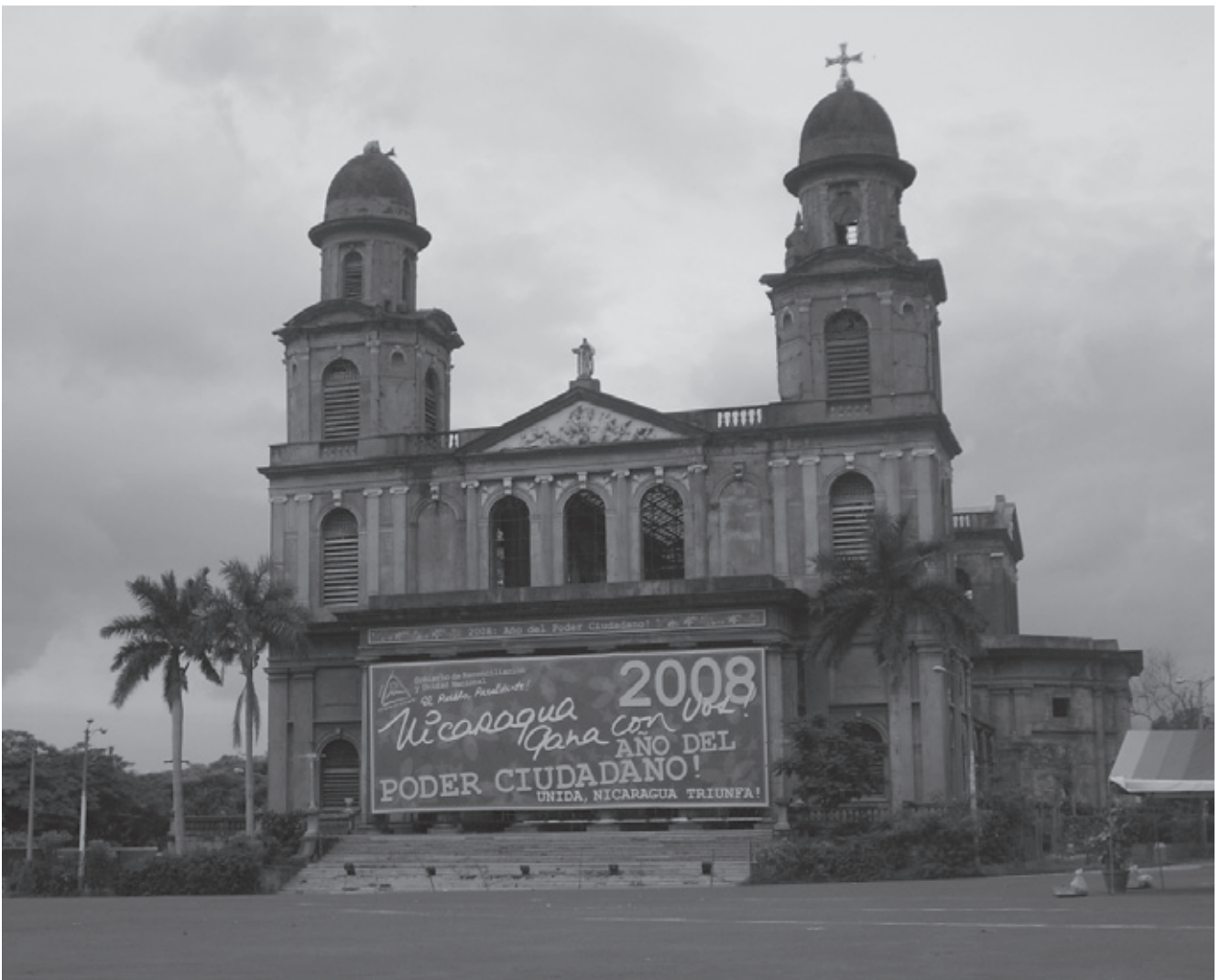
Bürger_innen an die Macht? Die Regierung wirbt intensiv für die Bürgerräte.

scheidendes Zugeständnis an die Rolle zivilgesellschaftlicher Organisationen und Bürgerkomitees vor allem auf Gemeindeebene.