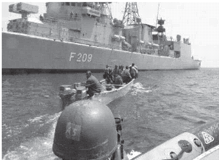
Unsere Schiffe überall im Einsatz

In Rahmen der EU ist die Verbindung zwischen Migration und Entwicklung erst seit 2002 relevant. Damals wurde Entwicklungspolitik in erster Linie als Mittel zur Steuerung von Migrationsströmen diskutiert.