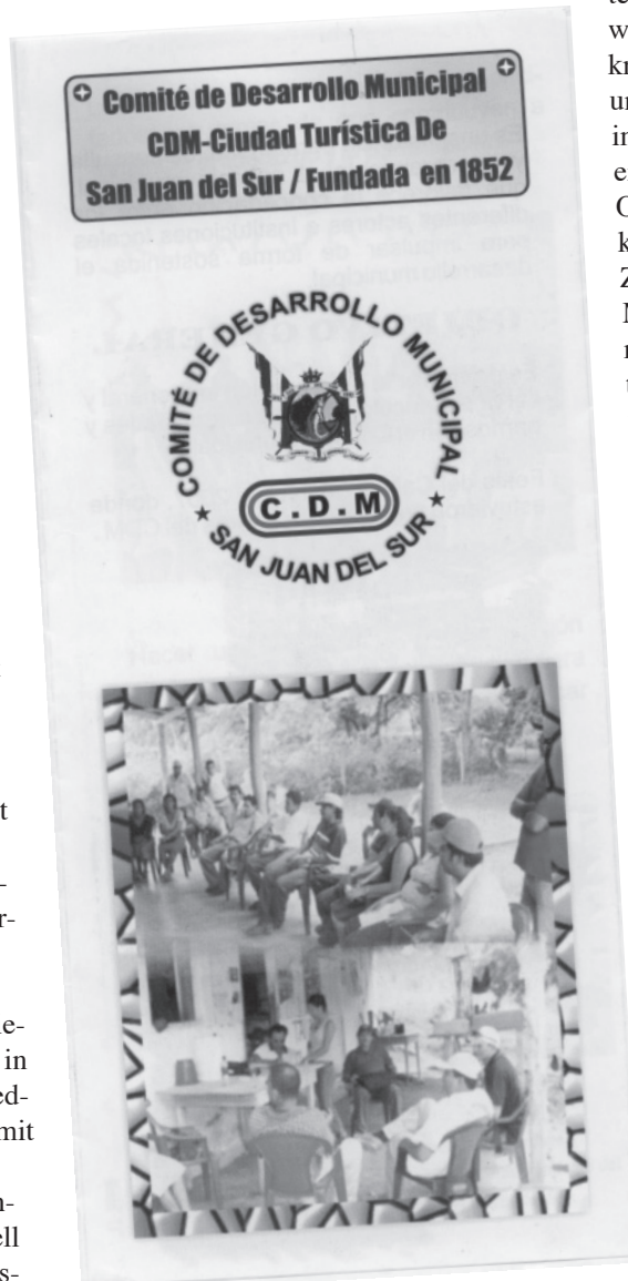
Flyer des kommunalen Entwicklungskomitees, San Juan del Sur

des Landes regional als eine der partizipativsten gilt. Dies ist vor allem ein Erbe der sandinistischen Revolution, deren Regierung in den 1980er Jahren eine breite gesellschaftliche Beteiligung an politischen, sozialen und wirtschaftlichen Anliegen for-