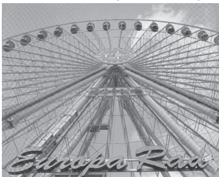
Das EU-Rad: es leuchtet, es glitzert, es verspricht schöne Ausblicke... Wer kriegst den Platz an der Sonne ganz oben? Wo sind die Hamster, die das Rad antreiben? Und vor allem: Wer hat dem Rad den prophetischen Namen „Kipp!“ angeschraubt?