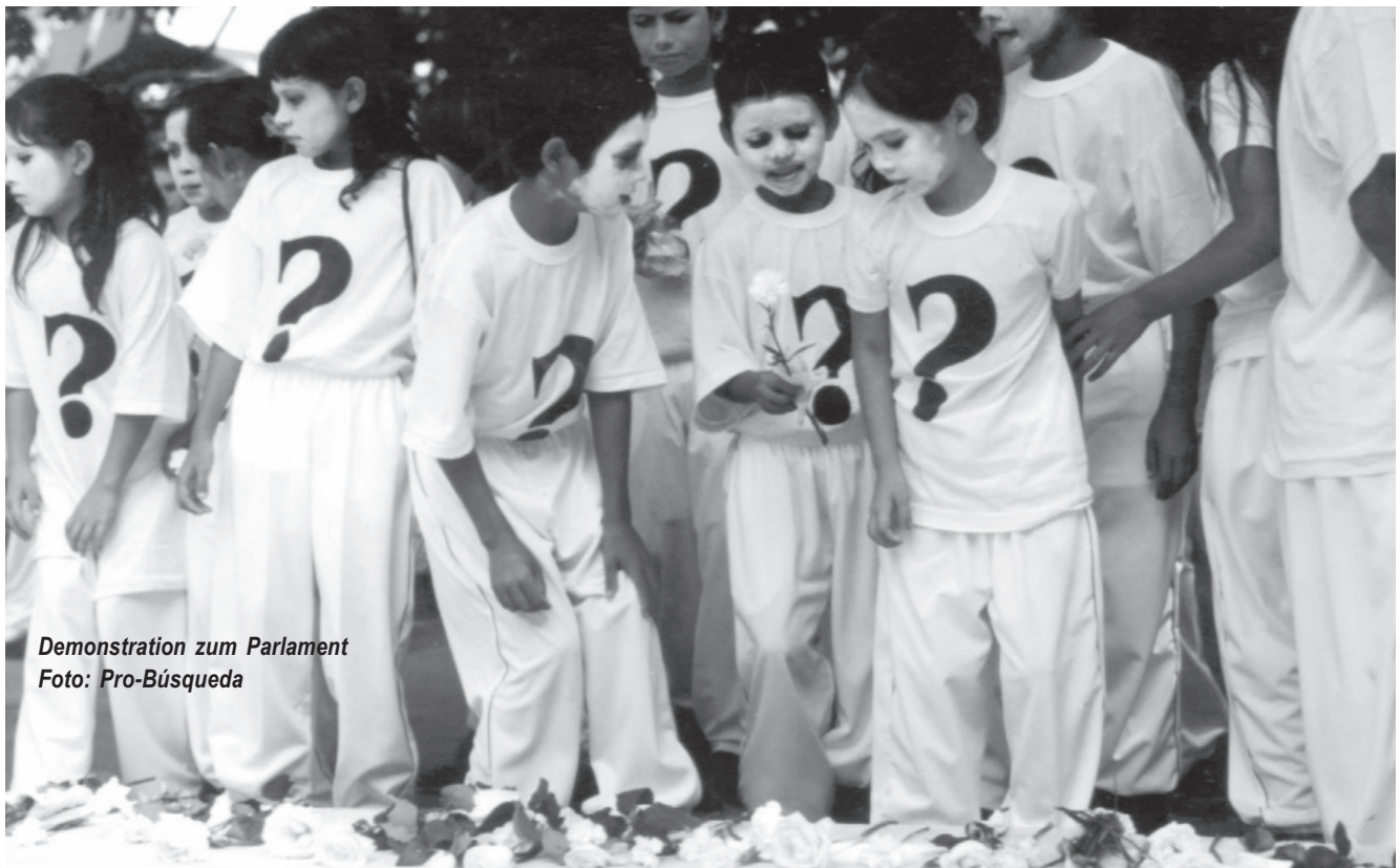
Demonstration zum Parlament