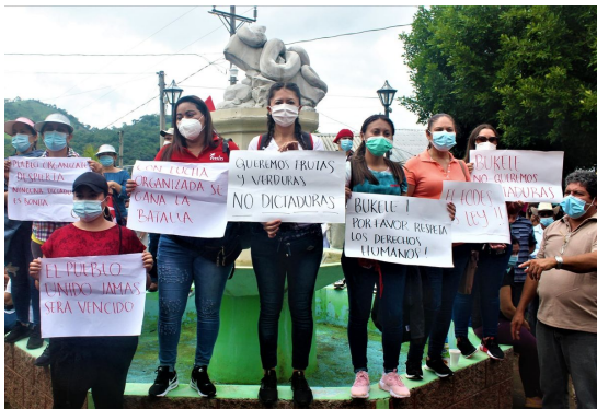
Proteste gegen die Militarisierung

Im Zuge der CORONA Pandemie wurde die Militärpräsenz in der salvadorianischen Provinz Chalatenango zunächst als "Maßnahme zur Verhinderung der Ausbreitung des Covid-19-Virus" eingeführt. Mehr und mehr, regt sich jedoch Widerstand in der Bevölkerung, die Angst vor Übergriffen durch das Militär wächst. Auch die Arbeit von Gemeindeorganisationen wie der „Vereinigung der Gemeinden zur Entwicklung von Chalatenango“ (CCR), das Hand in Hand mit der Bevölkerung für eine ökologische, soziale und nachhaltige Entwicklung von der Basis her eintritt, wird durch die aktuelle Situation erschwert.