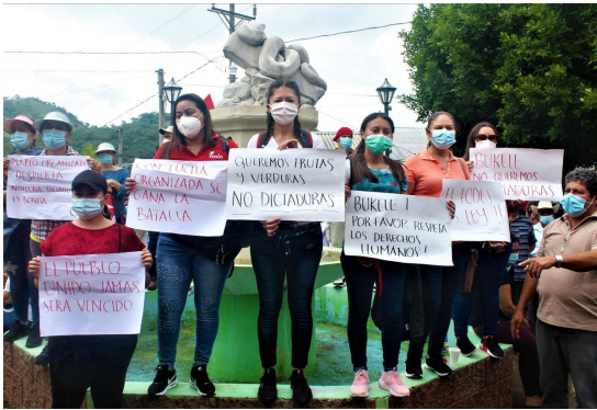
Proteste gegen die Militarisierung

Im Zuge der CORONA Pandemie wurde die Militärpräsenz in der salvadorianischen Provinz Chalatenango zunächst als "Maßnahme zur Verhinderung der Ausbreitung des Covid-19-Virus" eingeführt. Mehr und mehr, regt sich jedoch Widerstand in der Bevölkerung, die Angst vor Übergriffen durch das Militär wächst. Auch die Arbeit von Gemeindeorganisationen wie der „Vereinigung der Gemeinden zur Entwicklung von Chalatenango“ (CCR), das Hand in Hand mit der Bevölkerung für eine ökologische, soziale und nachhaltige Entwicklung von der Basis her eintritt, wird durch die aktuelle Situation erschwert.