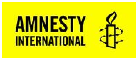
El Salvador-Koordinationsgruppe 71317 Waiblingen