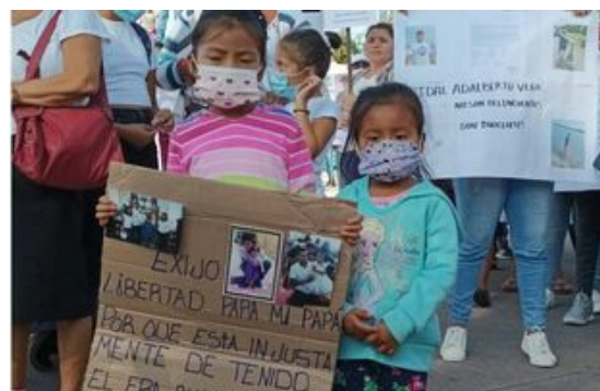
El Salvador im Ausnahmezustand 2022. Angehörige von willkürlich Verhafteten fordern deren Freilassung.