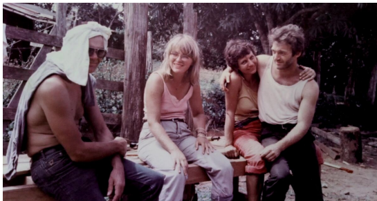
Filmstill © HOPE MEDIEN Film- und Fernsehproduktion

„Eine ebenso persönliche wie ernüchternde Dokumentation über ein geschundenes Land.“ (Cinema)